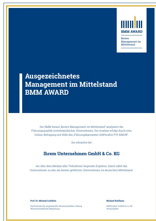
Die Urkunde für ausgezeichnete Unternehmen

Die Preisverleihung erfolgt im Rahmen des jährlichen „Führungssymposiums für den Mittelstand“, jeweils im November eines jeden Jahres.